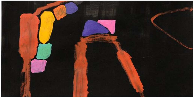
Michaële-Andréa Schatt: Noir d'ivoire. 2011. 65 cm x 50.