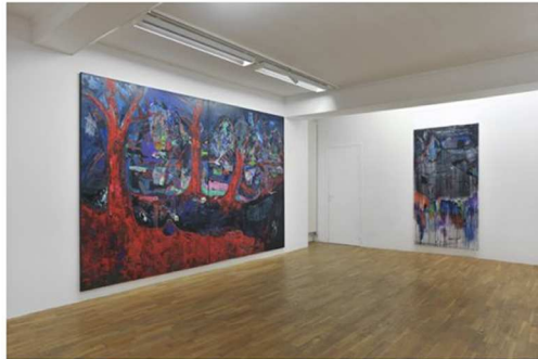
Michaële-Andréa Schatt: Arbres rouges. 2011.

Longtemps Michaële-Andréa Schatt a travaillé sur des fonds blancs mais aujourd'hui elle propose sa part d'ombre et une recherche sur l'obscurité, avec des fonds sombres. Une obscurité vivante, envahissante et ambiguë. L'artiste ose également le rose pour le paysage, ce qui est rare et porteur d'optimisme. Sa technique est double, soit elle intervient directement sur la toile, soit elle utilise la technique du recouvrement avec papiers de soie et calques. Elle se sert également de photos réalisées en extérieur grâce à un appareil argentique demi format qui permet de juxtaposer deux vues sur une même pause. Est-ce à cause de ces petits procédés techniques si ses œuvres donnent l'impression de puzzles à la recherche de leur propre cohérence? C'est probable et le charme de cette peinture vient certainement de là. Un exemple, ce paysage