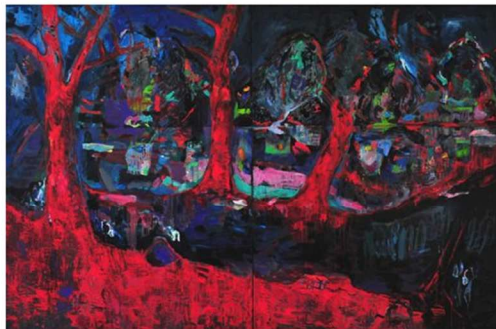
Michaële-Andréa Schatt: Paysage. 2011. Dyptique. 240 cm x 180 X 2.

, un grand dyptique d'extérieur nuit éclairé par quelques tâches roses et plusieurs bleus tendres en opposition aux arbres rouges du premier plan qui forment une barrière menaçante.