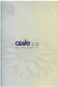
Code 2.0 n°10, Printemps 2015 Philippe Piguet, Maude Maris, Peintures d'espaces