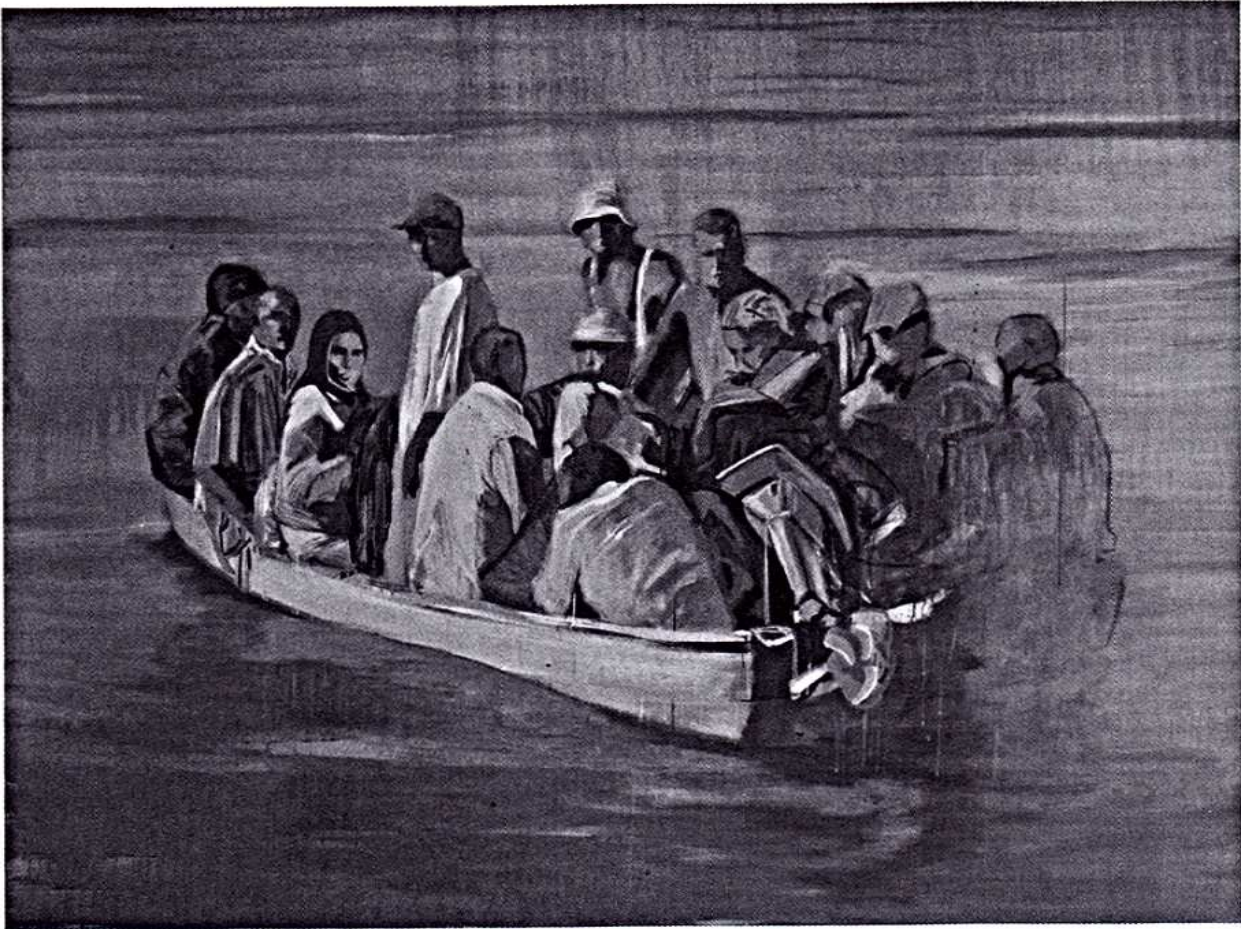
Claire Tabouret, Les Solitaires , 2011, acrylique sur toile, 180 x 250 cm Courtesy galerie Isabelle Gounod Crédit photo : Rebecca Fanuele

sujets qu'elle capte et leur confère un aspect d'éternité participe par ailleurs à excéder l'idée d'une objectivation.