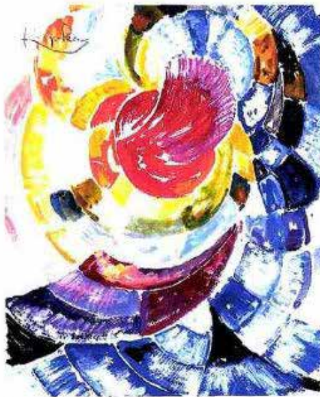
Frontišek Kupka, étude pour Disques de Newton , 1912, gouache sur papier, 18,2 x 15,3 cm.