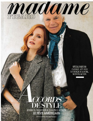
“Bulles Dada” Par Elisabeth Quin Madame Figaro, 30.11.2018