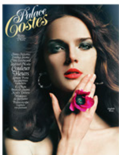
Palace Costes n°56, Février - Mars 2015 Lucie Tigoulet, «Eric Rondepierre», p. 158