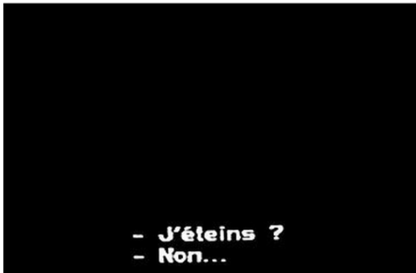
le Voyeur (Série « Excédents »), 1989, 80x120 cm © Éric Rondepierre

Prendre à contrepied les us et coutumes de l'art, Éric Rondepierre aime ça. Dans sa série la plus ancienne (et toujours en construction) présentée à la MEP, Excédents , l'artiste s'est appliqué à montrer, sortir de l'oubli, les images noires, qui ne devraient pas figurer dans le film, et pourtant, s'imposent sur certaines copies.