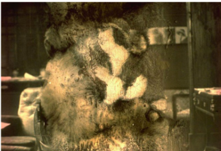
Série « Les trente étreintes » © Éric Rondepierre

1993, une bourse de la Villa Médicis hors les murs en poche, Éric Rondepierre part à Washington et découvre dans la cinémathèque, des pellicules détériorées. Le continuum de l'image se trouvant brisé, un travail colossal est entrepris : visionner les bandes image par image (Compter quinze jours de travail pour un long métrage, à raison de huit heures de visionnage par jour) . Beaucoup de perte, beaucoup de tri, subsistent quelques photogrammes étrangement endommagés. On est touchés devant la série Les Trente étreintes , soit trente photographies issues d'un même plan, d'un couple, abîmé -voire détruit- malgré lui, par le temps. Pas de sens de lecture précis devant cette oeuvre, mais une vision subtile d'un couple qui se dégrade.