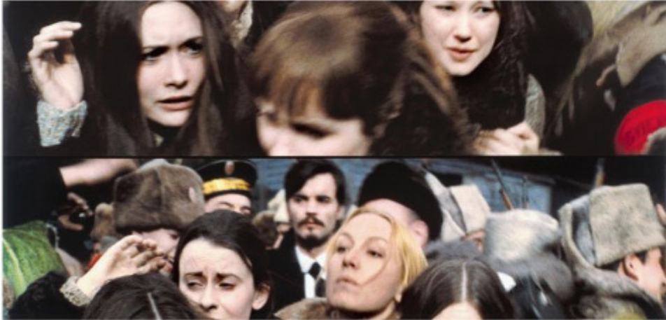
la foule (Série « Suites »), 1999-2001, 120x250 cm