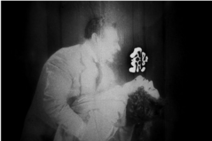
W1930A (Série « Précis de décomposition, Scènes »), 1993-95, 70x105 cm © Éric Rondepierre

Margaux Blondel, "Éric Rondepierre s'expose à la Maison Européenne de la Photographie"