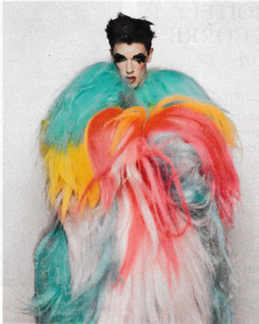
Georgeois Bourgeois, l'un des membres du duo de cabaret Bourgeois & Maurice.

de la «subculture» londonienne. Parmi les deux cents diptyques de sa série «Self Styled» (exposée pour la première fois à Paris), le performer Georgeois Bourgeois (moitié acclamée du duo de néocabaret Bourgeois & Maurice) tombe la veste grise pour un habit multicolore. Quand la question de l'identité devient un véritable show! — S.Si.