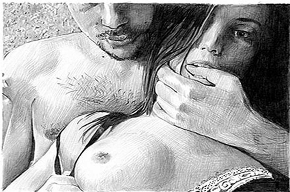
Thomas Lévy-Lasne, dessin de la série Webcam , crayon sur papier.

Exposition Visiblement de Thomas Lévy-Lasne à la Galerie Isabelle Gounod (13, rue Chapon 75003 Paris) jusqu'au 23 février.