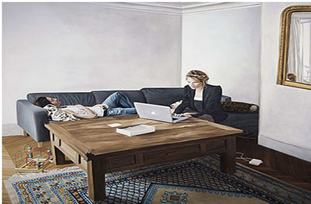
Thomas Lévy-Lasne, Couple 02 , huile sur toile.