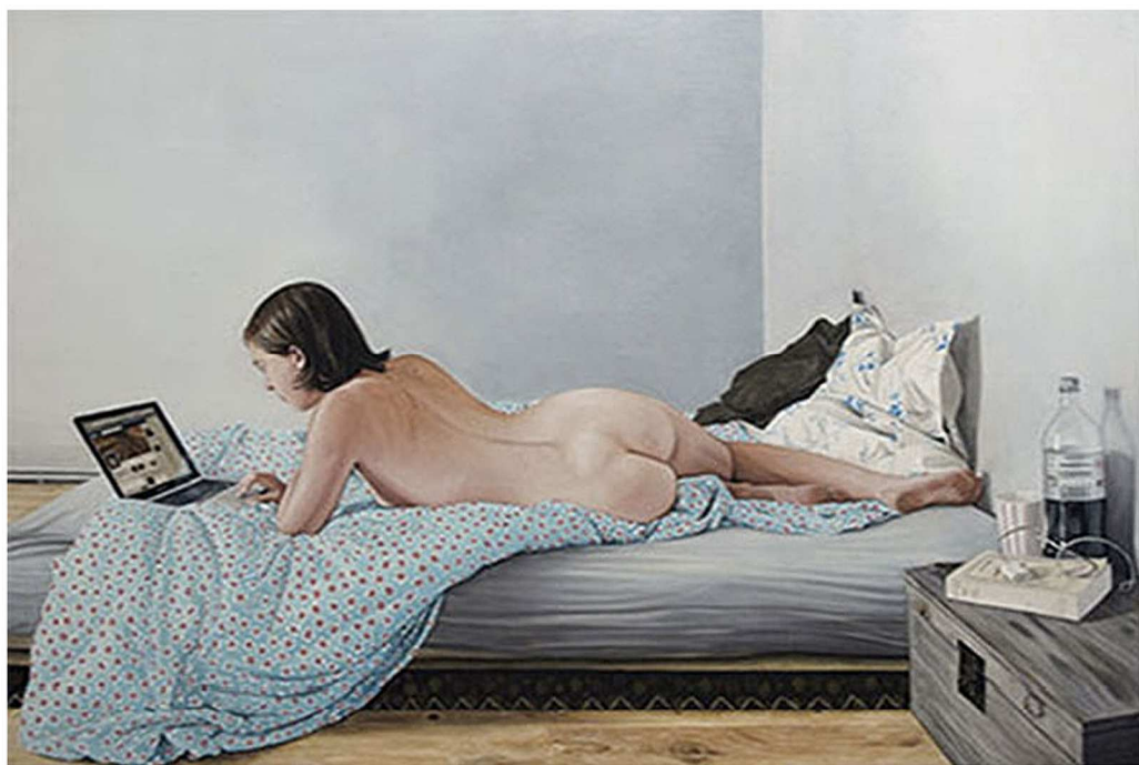
Thomas Lévy-Lasne, Laetitia au lit , huile sur toile.