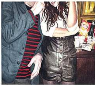
Fête 24, 2011 aquarelle sur papier, 15 x 20 cm

Thomas Lévy-Lasne est un artiste parisien complet, puisqu'il écrit, peint, et dessine. Ses images illustrent avec un réalisme percutant le quotidien le plus prosaïque, à travers des portraits sans fard ou des scènes de la vie quotidienne. Mais ce sont ses aquarelles de fêtes qui nous ont tapés dans l'oeil. A travers un mouvement de cheveux, un sourire coquin, des regards fatigués, ou la cambrure d'un dos, il restitue parfaitement l'essence lasse, sexy, désabusée de nos soirées. Un coup de coeur, on vous dit!