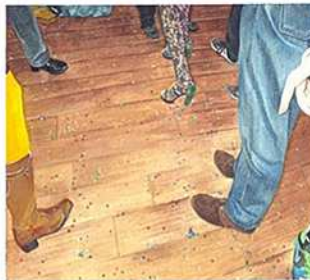
Fête 30, 2011 aquarelle sur papier, 15 x 20