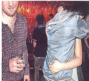
Fête 42, 2011 aquarelle sur papier, 15 x 20 cm