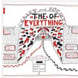
The Museum of Everything à Paris 2 réactions