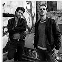
[ITW] Red Axes – Une house de feu et de glace