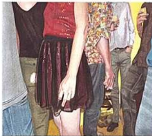
Fête 27, 2011 aquarelle sur papier, 15 x 20 cm