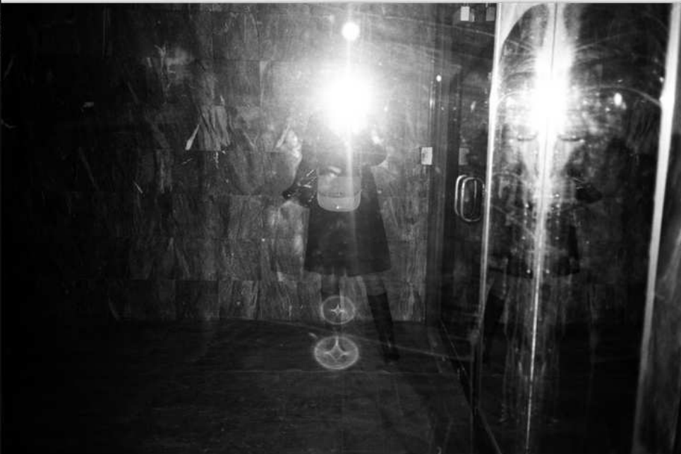
Lina Scheynius, série Calendar Project — 01 03 13, New York United states, poster, 2013 Courtesy de l'artiste