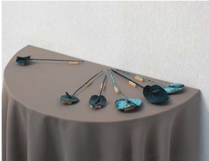
Rémy Brière, série Bronzes éphémères, anthurium , bronze, 2012