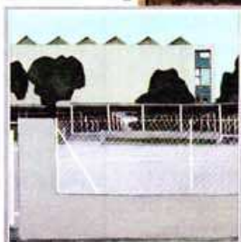
▲ «Paysage 54», huile sur toile, 123 cm x 123 cm.