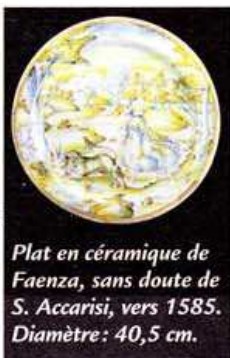
Plat en céramique de Faenza, sans doute de S. Accarisi, vers 1585. Diamètre: 40,5 cm.

PARIS (VII e ) 1 er -3 juin. ▼ 120 antiquaires et galeristes du VII e célèbrent avec magnificence le 35 e anniversaire du Carré Rive gauche. Entrée libre. BIÈVRES (91) 2-3 juin. La 49 e édition de la foire internationale de la photographie. Entrée libre. PARIS (XV e ) 16-17 juin. Les antiquaires du Village Suisse vident leurs réserves. Entrée libre.