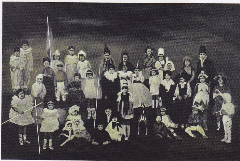
Claire Tabouret, Les Insoumis , 2013, acrylique sur toile, 260 x 390 cm (COLLECTION PRIVÉE).