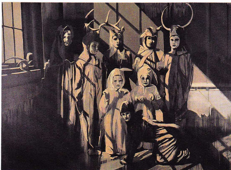
CLAIRE TABOURET Dans les bois, 2013

«Claire Tabouret - Prosôpon» jusqu'au 31 octobre 13, rue Chapon · 75003 Paris · 01 48 04 04 80 · www.galerie-gounod.com