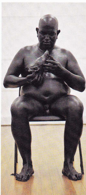
FRANKO B Love in Time of Pain, 2008

«Le corps en œuvre» jusqu'au 2 novembre 12, rue de Picardie · 75003 Paris 01 71 20 90 41 www.coullaudkoulinsky.com