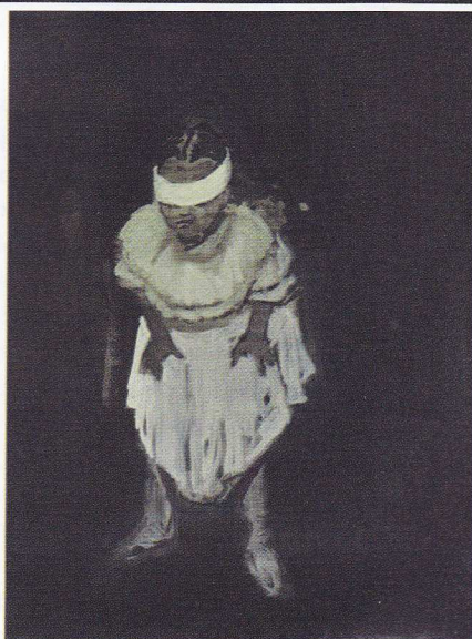
>> L'affront , 2013, acrylique sur toile, 145 x 200 cm