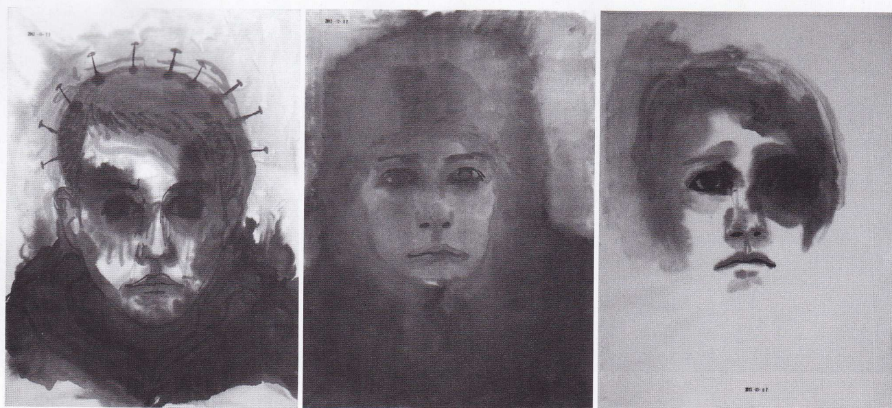
Autoportraits, encre de chine sur papier de riz, 45 x 33 cm