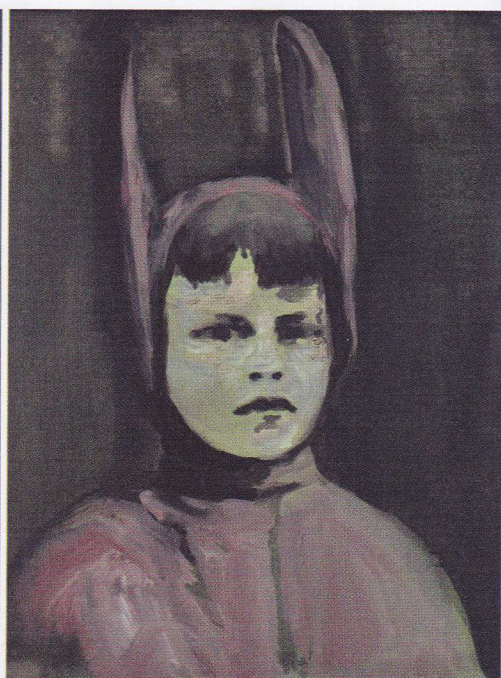
^ Les Insoumis , 2013, acrylique sur toile, 260 x 390 cm.