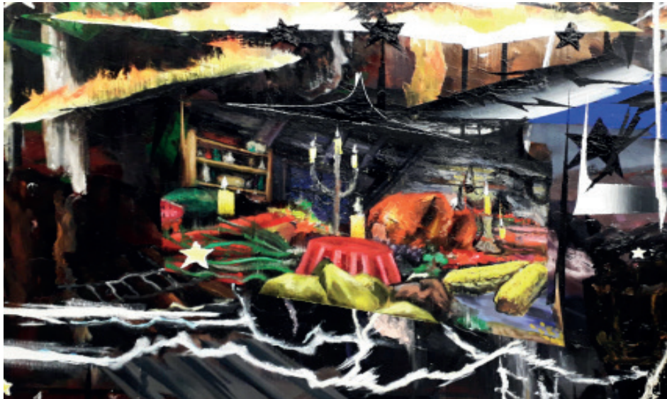
Pierre Aghaikian RedDeadRedemption , 2018 (détails)