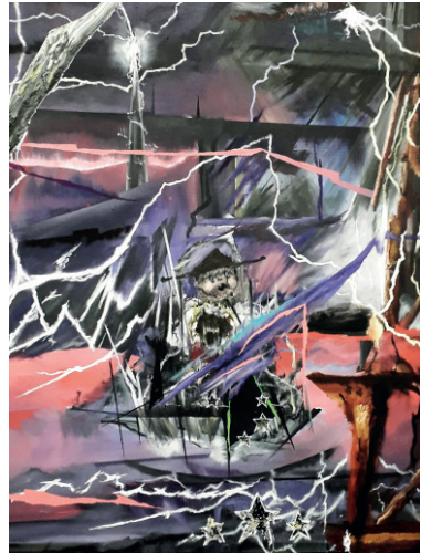
Pierre Aghaikian KingdomHearts2850xmph , 2018 (détails)