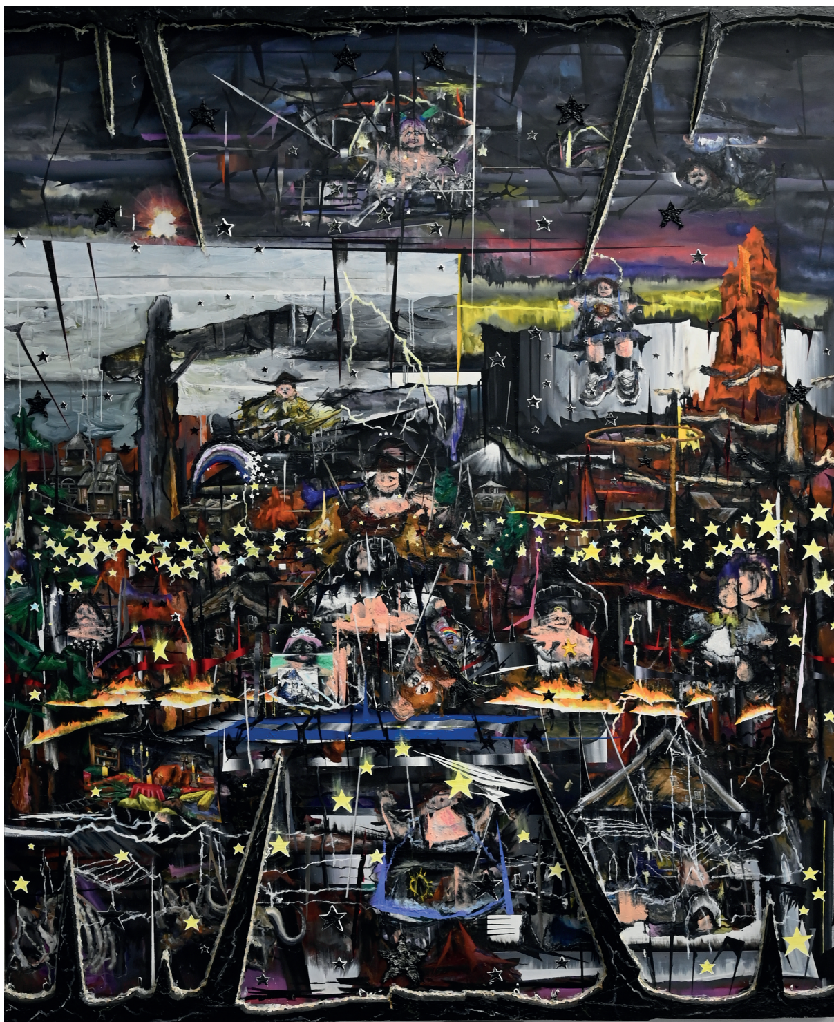
Pierre Aghaikian RedDeadRedemption , 2018 Huile sur toile, polystyrène 275 x 230 cm