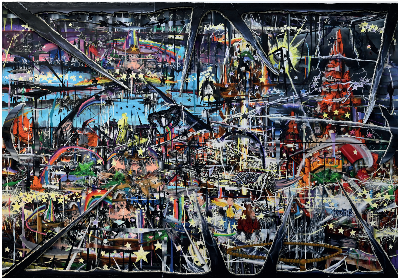
Pierre Aghaïkian God sold me another life and he made a prophet 2019 Huile sur toile, polystyrène 230 x 334 cm