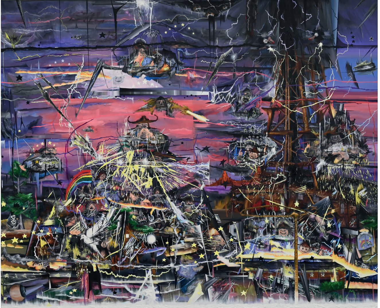
Pierre Aghaikian KingdomHearts2850xmph , 2018 Huile sur toile 230 x 285 cm