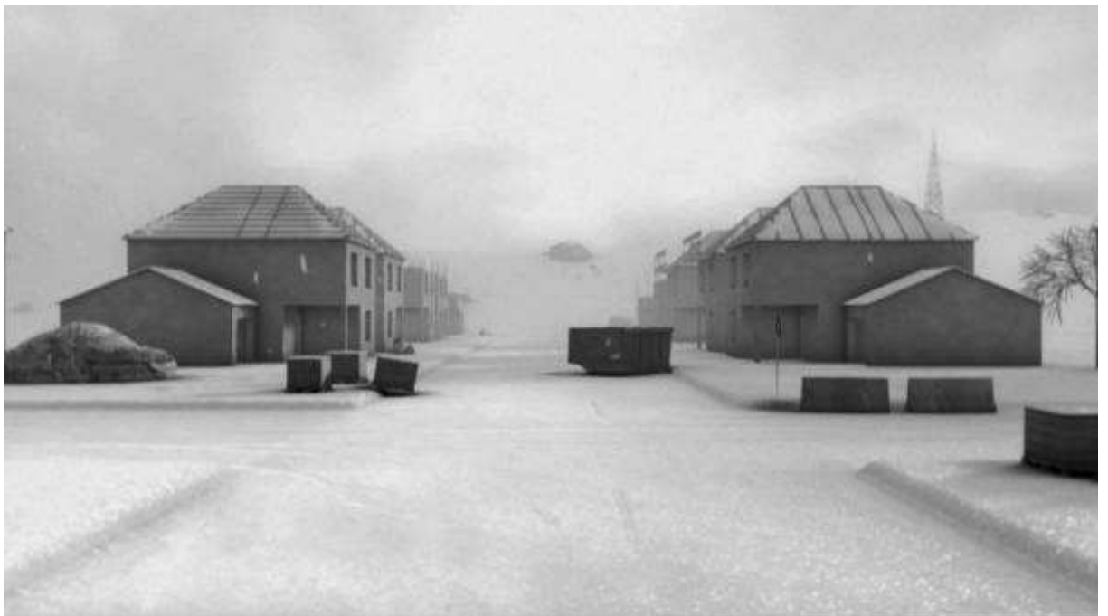
High Latency (2007) DVD-vidéo PAL - 12 minutes en boucle son 5.1