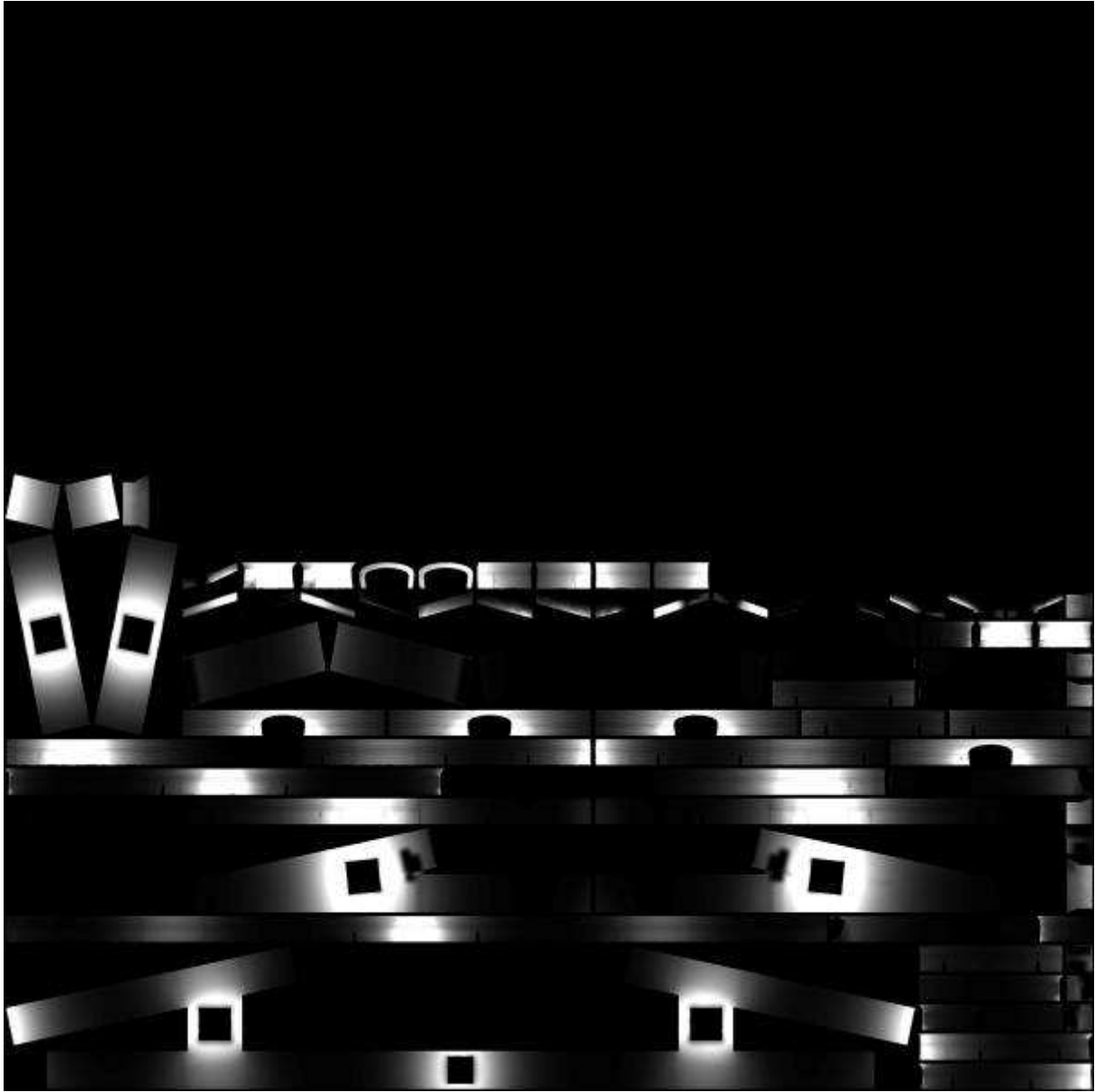
Lightmaps (2009) Photographie 100 cm X 100 cm - tirage lambda sur aluminium