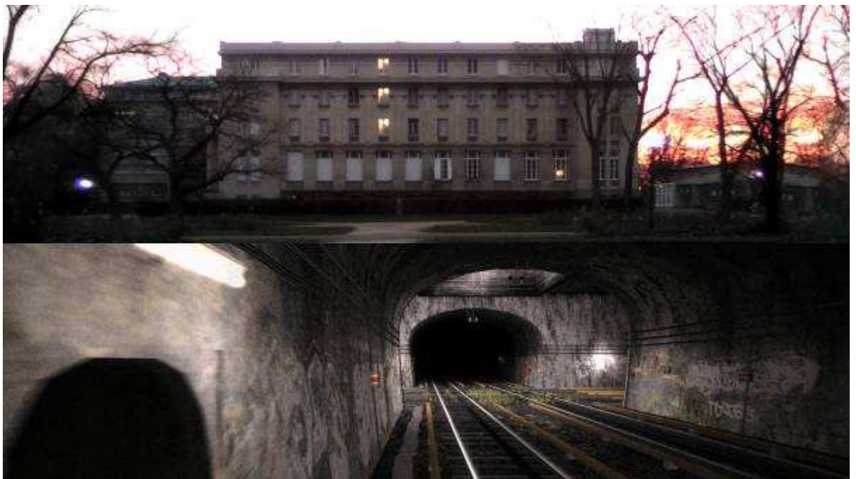
The Time Machine (2009) DVD HD 720p25 - 23 minutes 25 en boucle son stéréo