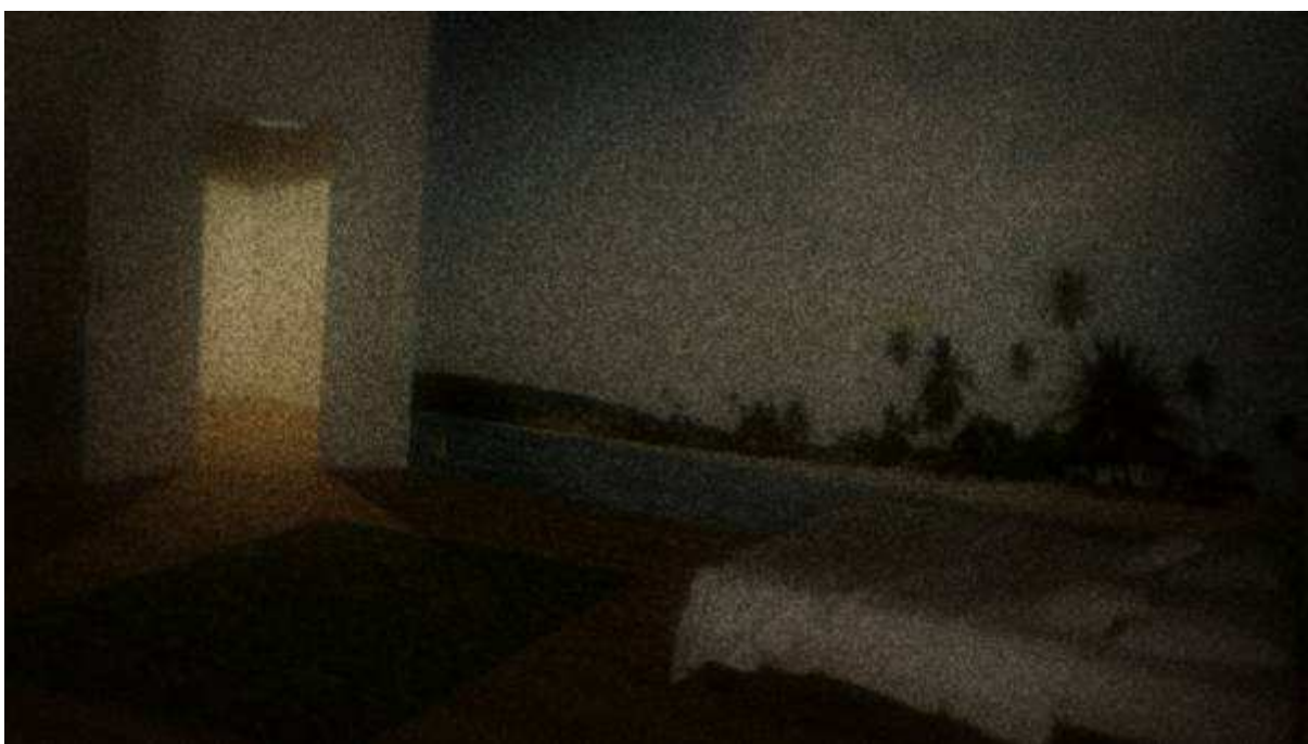
Exposition automatique (2008) DVD-vidéo PAL - 13 minutes 16 en boucle son stéréo