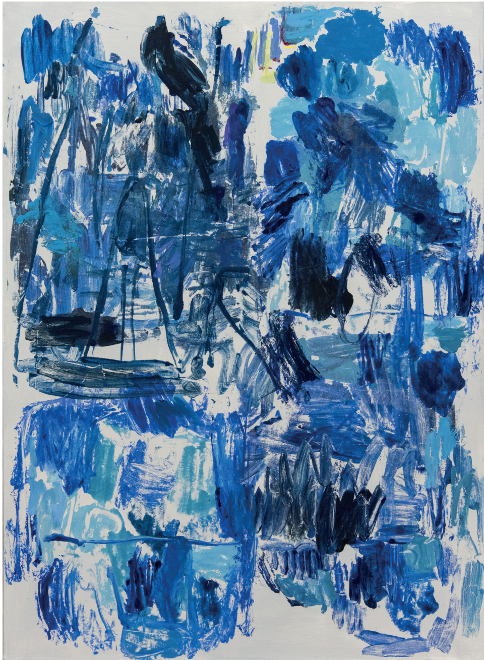
Michaële-Andréa SCHATT Shadow of Blue , 2020 Techniques mixtes sur toile 148 x 108 cm