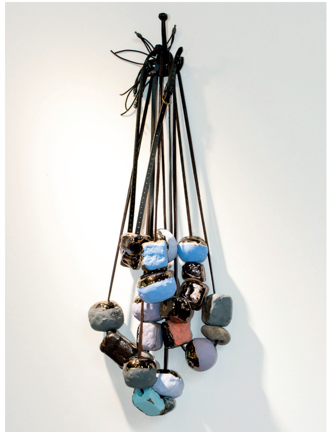
Michaële-Andréa SCHATT Necklace , 2019 Céramique (émail platine et engobes colorés), silex marin, ceintures de femme en cuir env. 90 x 30 cm