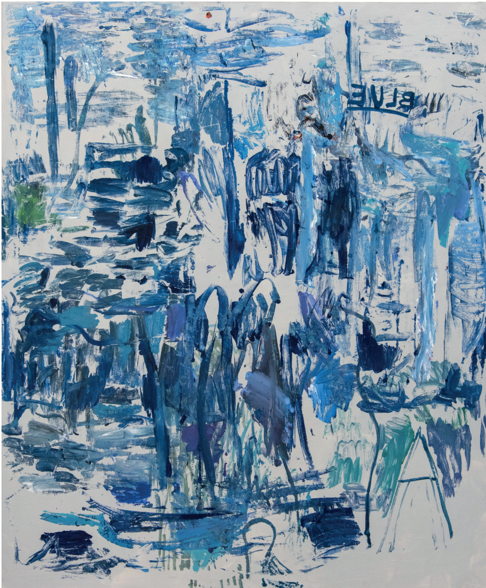
Michaële-Andréa SCHATT, Blue , 2020, techniques mixtes sur toile, 180 x 150 cm.