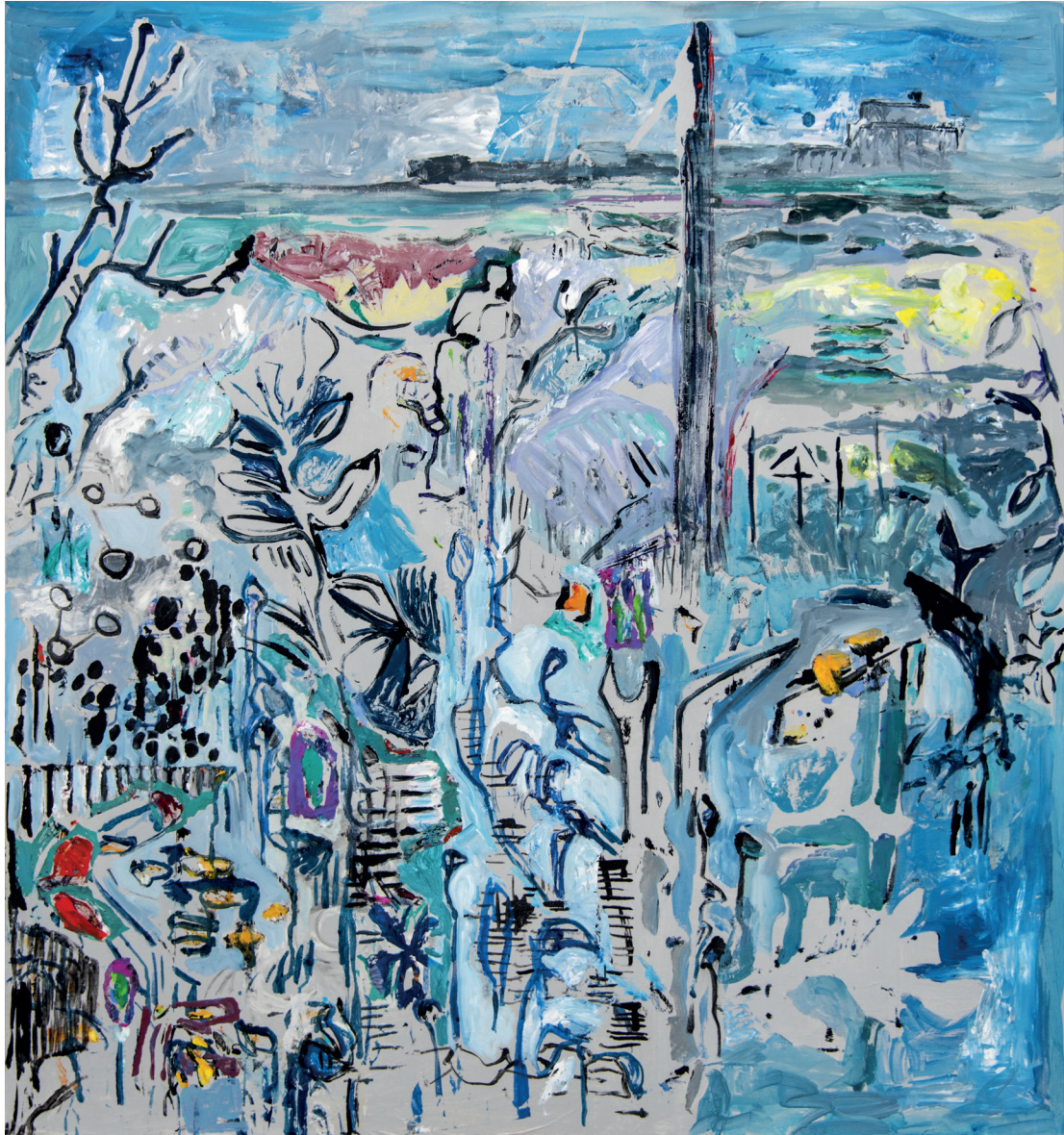
Michaële-Andréa SCHATT Errance , 2020 Techniques mixtes sur toile 150 x 140 cm