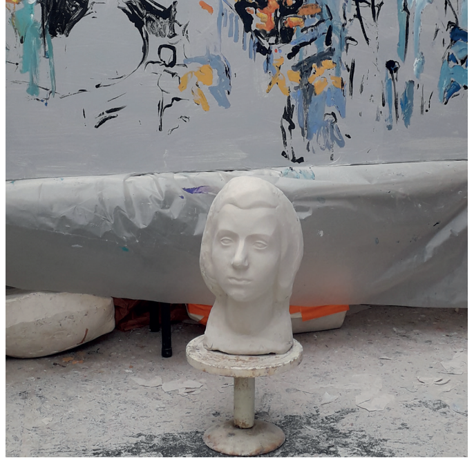
Vues d'atelier, février 2020