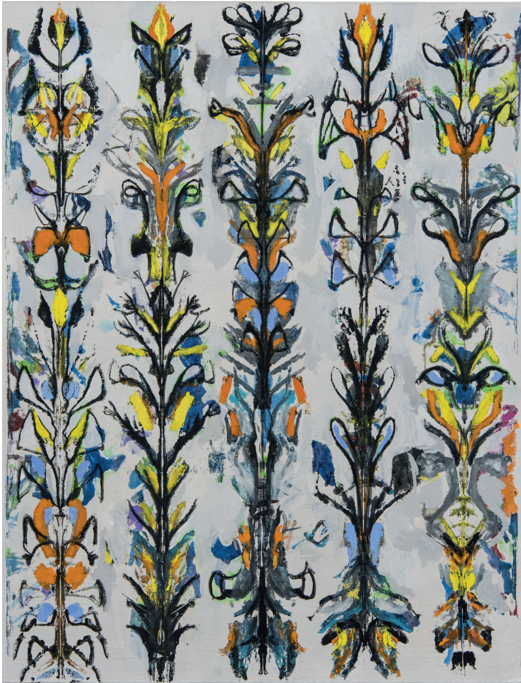
Michaële-Andréa SCHATT Opium Poppies , 2020 Techniques mixtes sur toile 116 x 89 cm