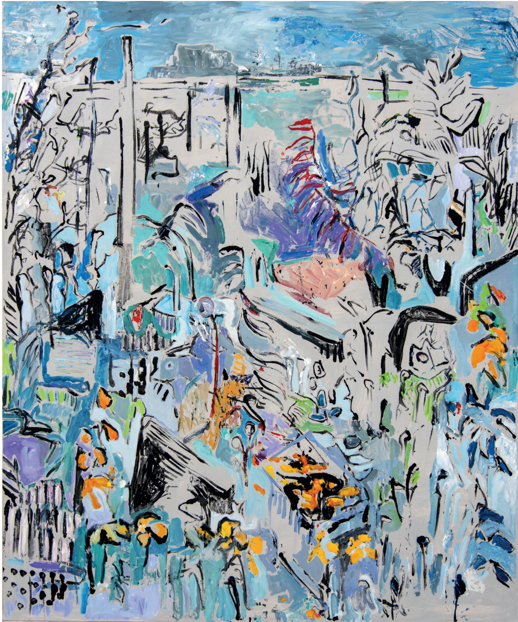
Michaële-Andréa SCHATT DJ's Garden , 2020 Techniques mixtes sur toile 180 x 150 cm