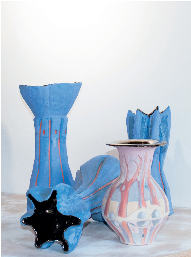
Michaële-Andréa SCHATT Blue series , 2019 Céramique / émail platine et engobes colorés env. 36 x 16 cm / chaque