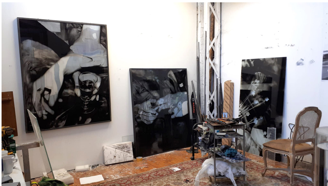
Vue d'atelier, Le Houloc (Aubervilliers), 2023