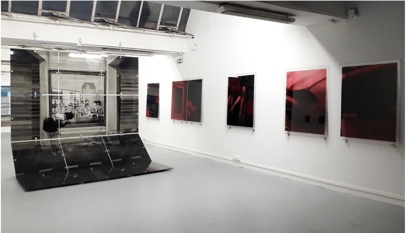
Exposition de diplôme de 5ème année, 2018 École Nationale Supérieure des Beaux-Arts de Paris / Atelier Dominique Gauthier