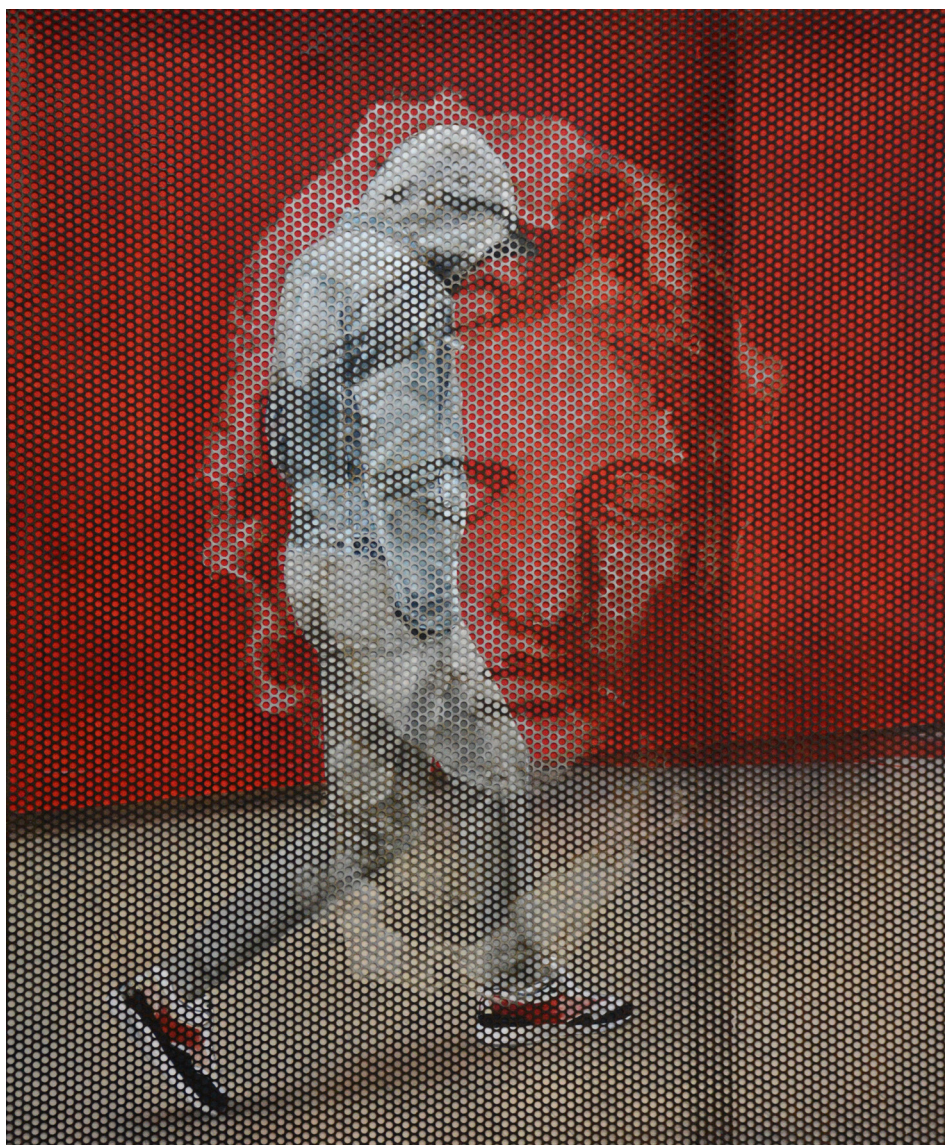
Lenny Rébéré, Passant 1 , 2018, huile sur toile et tôle perforée, 162 x 130 cm